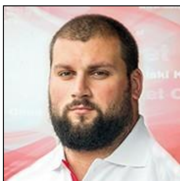
Michał Haratyk lekka atletyka - kula